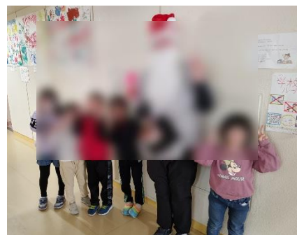
ALTと一緒にメリークリスマス！