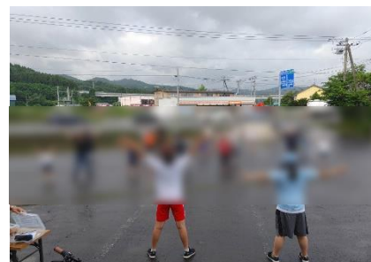
【数年ぶりに開催されたラジオ体操】

メダルを獲得することだけが全てではありませんが、これは、当然普段からの厳しい練習に耐えてきたことや、プレッシャーに負けなかったという個々の力のたまものだと思います。また、選手のインタビューを聞いていると、勝っても負けても必ず周囲に対する感謝の言葉が述べられていました。一流と言われる選手の方々は、日々の練習等を通して身体や技を鍛えるだけでなく、豊かな心も身につけていくんだと改めて感じました。一方、選手たちのひたむきにスポーツに打ち込む姿に感動する反面、SNS などによるインターネット上での他への誹謗中傷や心を傷つけるような心無い投稿が世界中で横行している状況に、深い切なさ大きな危機感を感じさせられました。