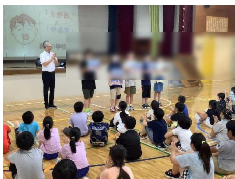
【夏休み明け集会での表彰式 (とべとべマンデー)

23日に行われた夏休み明けの集会ではこれらのオリンピックの感想を含めて次の3つのことを話しました。