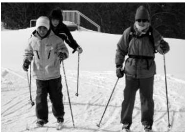
第9回町民歩くスキーの集い(昨年の様子)

■八雲町総合体育館 ☎0137-62-2141 【開館時間】 午前9時30分～午後9時 ※日曜日・祝日は午後5時まで 【休館日】 月曜日、年末年始 ■熊石教育事務所 ☎01398-2-3111