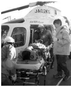
運航開始に備え11月に訓練が実施されました

※八雲町内のランデブーポイントは学校や公共施設敷地内など20箇所を選定していません。