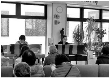
ロビーコンサート