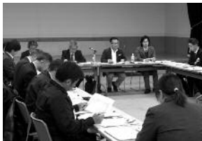
レポート案を協議する広域観光 連携協議会の会議風景

私たち協力隊の任期も残すところ1年 と少し、これからも、皆さんにいろいろ 教わりながら、 一緒に八雲町を 盛り上げ、八雲 町のいいところ を町外にPRし ていくために、 頑張っていきた いと思います。