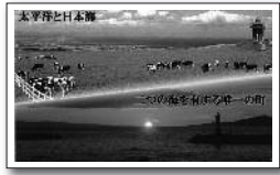
裏面(太平洋と日本海)