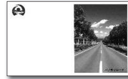
表面(パノラマロード)