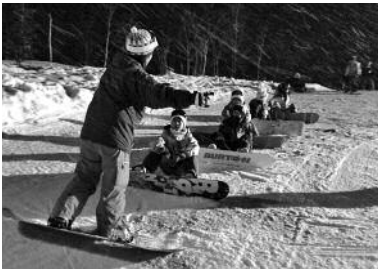
スノーボード教室 (昨年の様子)

■八雲町総合体育館 ☎0137-62-2141 【開館時間】 午前9時30分～午後9時 ※日曜日・祝日は午後5時まで 【休館日】 月曜日、年末年始 ■熊石教育事務所 ☎01398-2-3111