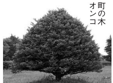
町の オ ン コ 木