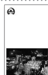
表面(八雲山車行列)