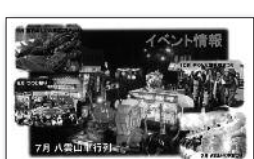
裏面(イベント情報)