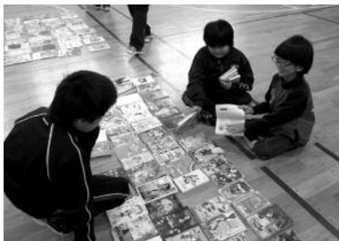
野田生小学校 学校図書館フェスティバル の様子 12月16日(水)