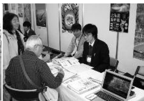
北海道暮らしフェア(東京)