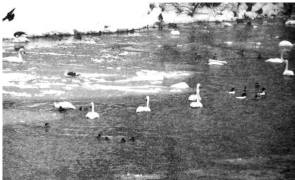
「清流建岩橋(鉛川方面)」ワシ類、カモ類、白鳥など多くの野鳥が休憩する冬の観察スポットです