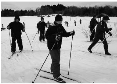
第10回 町民歩くスキーの集い (昨年度の様子)

■八雲町総合体育館 ☎0137-62-2141 【開館時間】 午前9時30分～午後9時 ※日曜日・祝日は午後5時まで 【休館日】 月曜日、年末年始 ■熊石教育事務所 ☎01398-2-3111