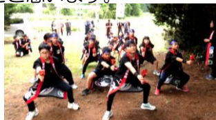
●東野ソーラン演舞