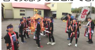
●わっしょい「子ども神輿」

子ども神輿、東野ソーラン披露、子ども相撲、どの場面においてもとても温かい歓待を受けました。今年も地域・家庭・学校が一体となり、子どもたちを「めんこがる」こと、育てていることを皆で実感することができたと思います。