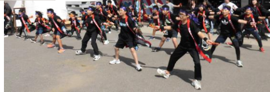
●東野小卒業生と共に東野ソーラン

子どもたちは2日間頑張り抜きました。とても立派でした。お祭りで大きく成長させていただきました。東野地域の人々の温かさを一層強く感じたお祭りでした。本当にありがとうございました。