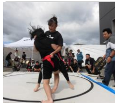
●熱戦！奉納子ども相撲