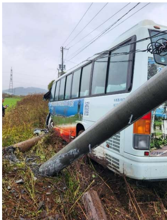
↑ 電柱へ衝突した後に停止した。