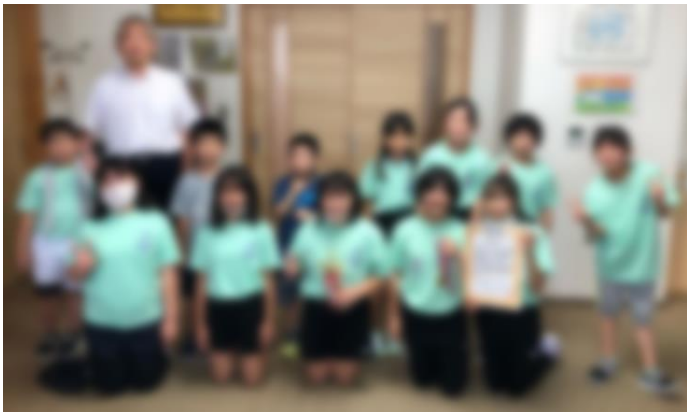
校長室で表彰式を行いました。

第9回北海道パーケット工業杯 函館地区小学生バレーボール交流大会で第3位となりました。おめでとうございます。