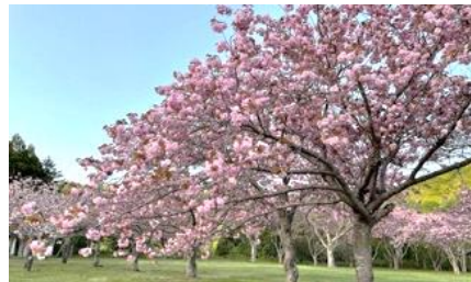
熊石キャンプ場の桜です

協力隊の活動は、町のHPや協力隊員が発信しているSNS等でも知ることができます。それぞれの視点で八雲町の魅力も発信しています。よかったらチェックしてみてくださいね！