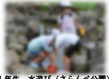
1年生 水遊び (さらんべ公園)

緊急事態宣言中のため、実際にお店に行くことはできませんでしたが、クロムブックのmeet機能を使って、お店の人の説明を聞いたり質問したりしながら学習しています。